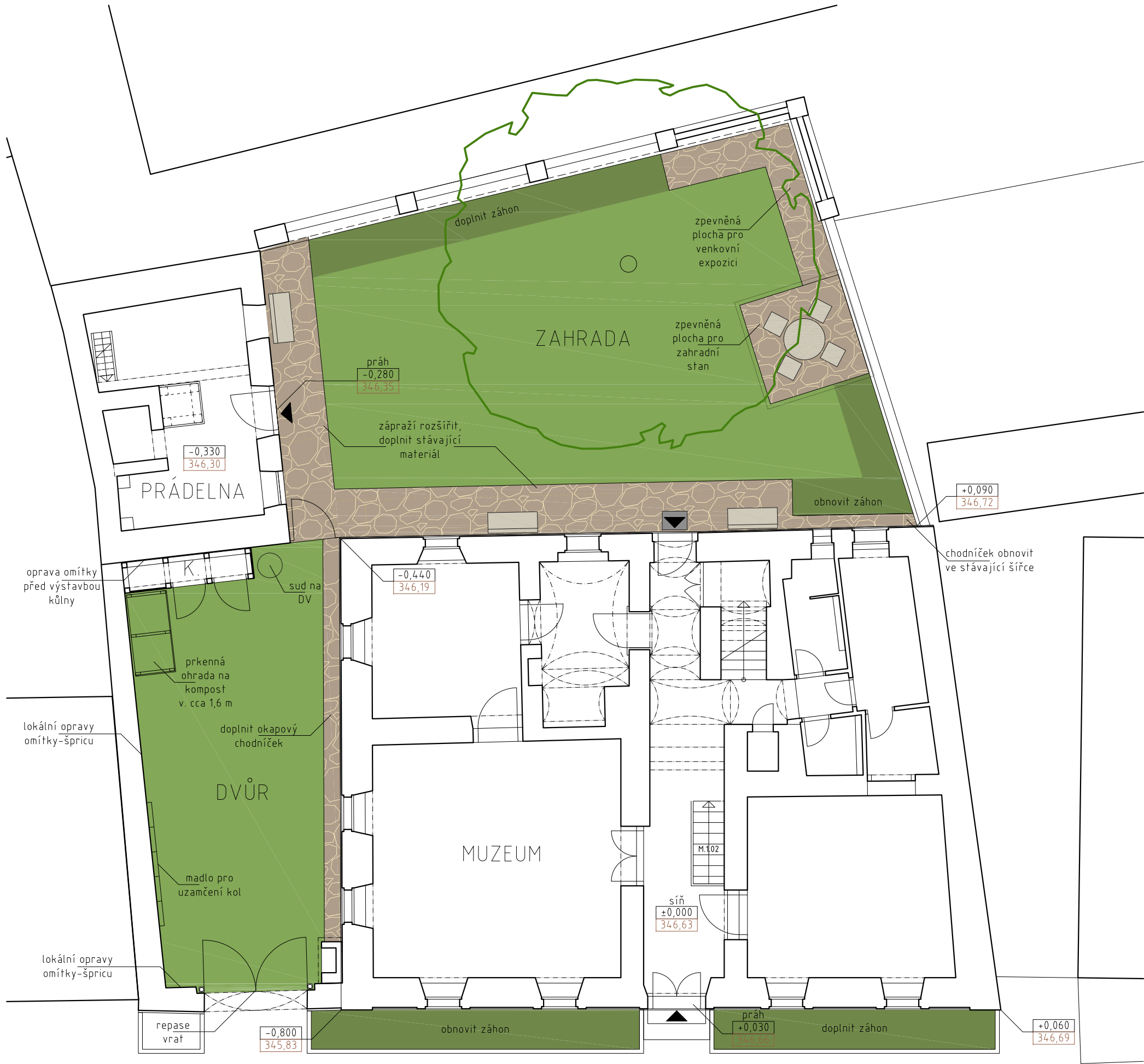
TABULKA ZPEVNĚNÝCH PLOCH A PLOCH ZELENĚ